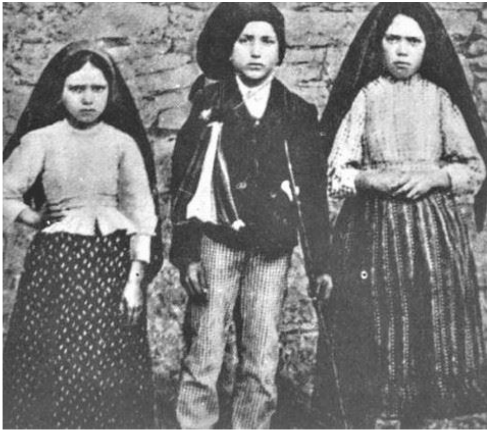
Seherkinder von Fatima